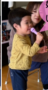
好きな食べ物は… いちごです！！