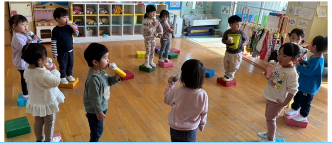
ステージに立って歌をうたっているよ♪