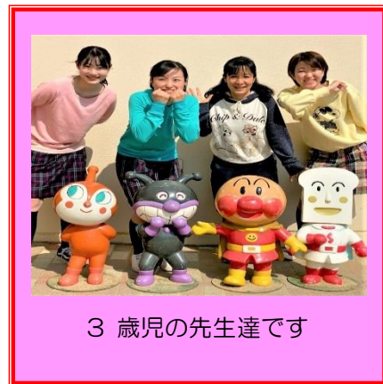
3歳児の先生達です