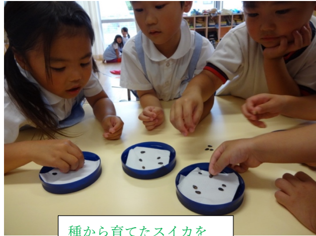
種から育てたスイカを 毎日お世話