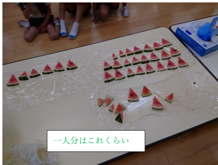
一人分はこれくらい