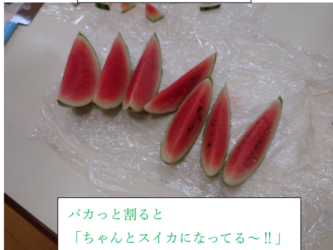
パカッと割ると 「ちゃんとスイカになってる～!!」