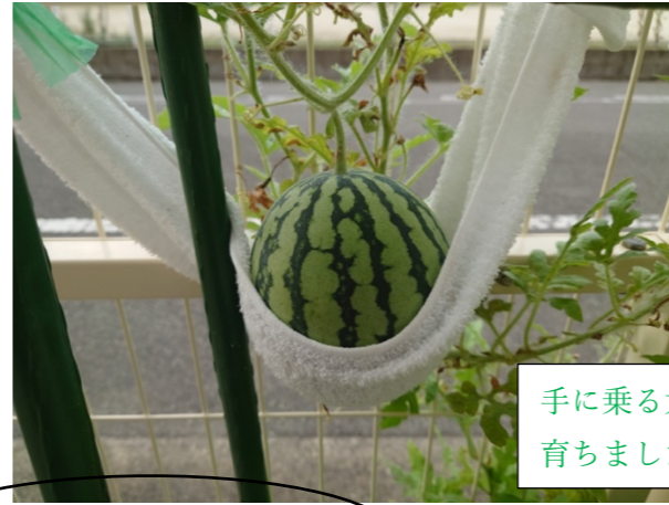
手に乗る大きさまで 育ちました