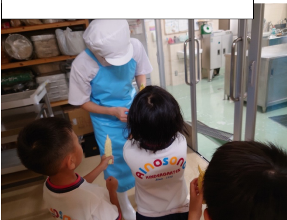
88人分、みんなが食べられるように 準備してくれました。 膨らんでいる粒は甘くて美味しかったよ。