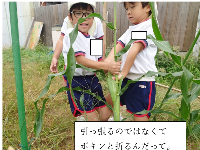
引っ張るのではなくて ポキンと折るんだって。