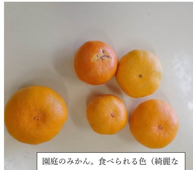
園庭のみかん。食べられる色（綺麗な オレンジ色）になるまで早く早くと首 を長くして待っていました。