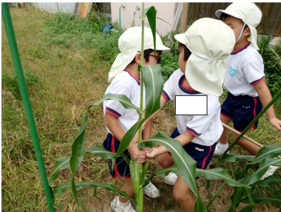
ビオトープでとうもろこしを収穫 皮を剥いてみると・・・