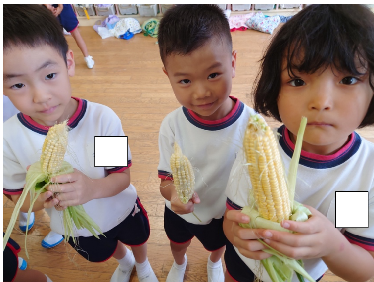
お店で売っているのより小さいね。 つぶつぶが膨らんでいないよ。